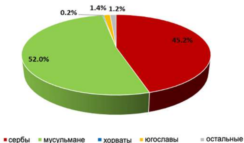
Рис. 8. Этническая структура населения Сараевско-Зворникского региона согласно переписи 1991 г.