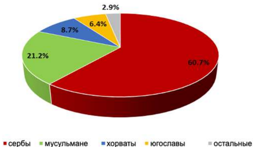
Рис. 4. Этническая структура населения Банялукского макрорегиона согласно переписи 1991 г.