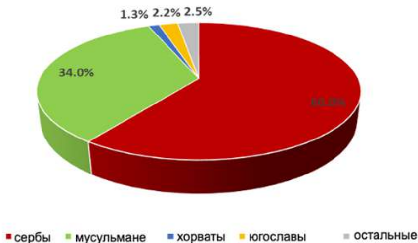
Рис. 10. Этническая структура населения Требинско-Фочанского региона согласно переписи 1991 г.