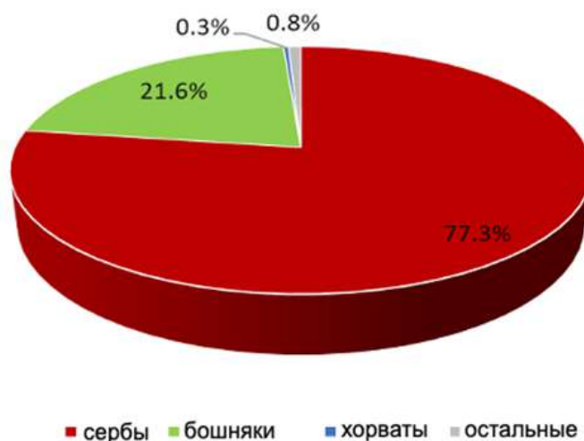
Рис. 9. Этническая структура населения Сараевско-Зворникского региона согласно переписи 2013 г.