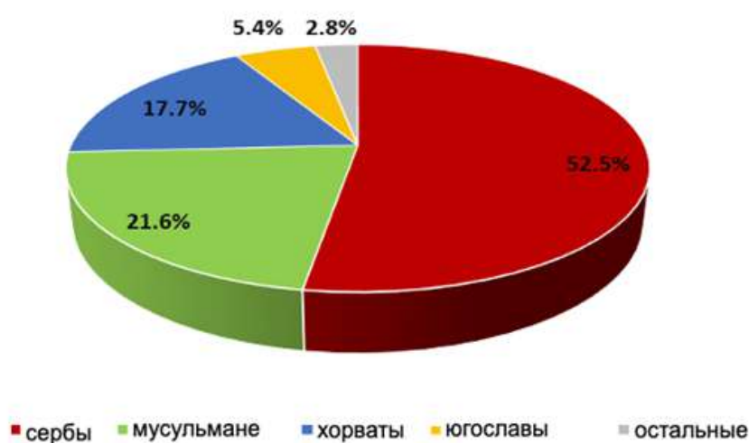
Рис. 6. Этническая структура населения Добойско-Биелинского региона согласно переписи 1991 г.