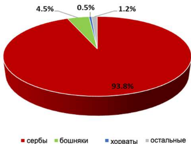
Рис. 11. Этническая структура населения Требинско-Фочанского региона согласно переписи 2013 г.