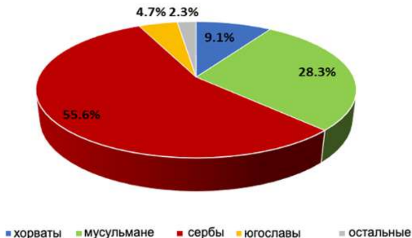
Рис. 2. Этнонациональная структура населения Республики Сербской согласно переписи 1991 г.