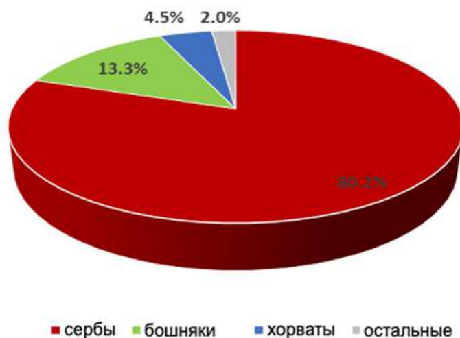
Рис. 7. Этническая структура населения Добойско-Биелинского региона согласно переписи 2013 г.