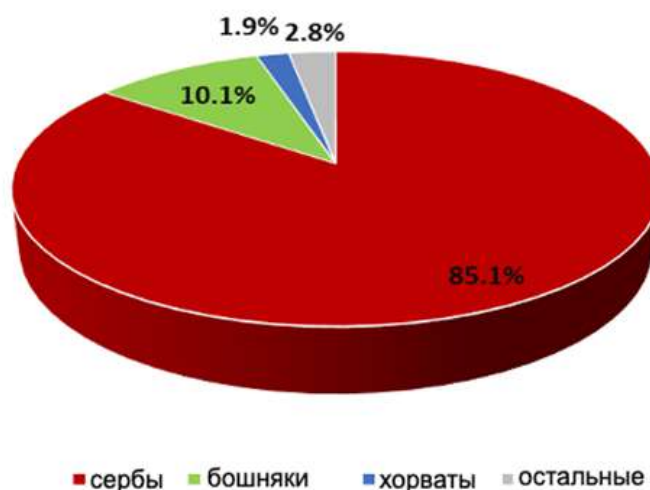
Рис. 5. Этническая структура населения Банялукского макрорегиона согласно переписи 2013 г.