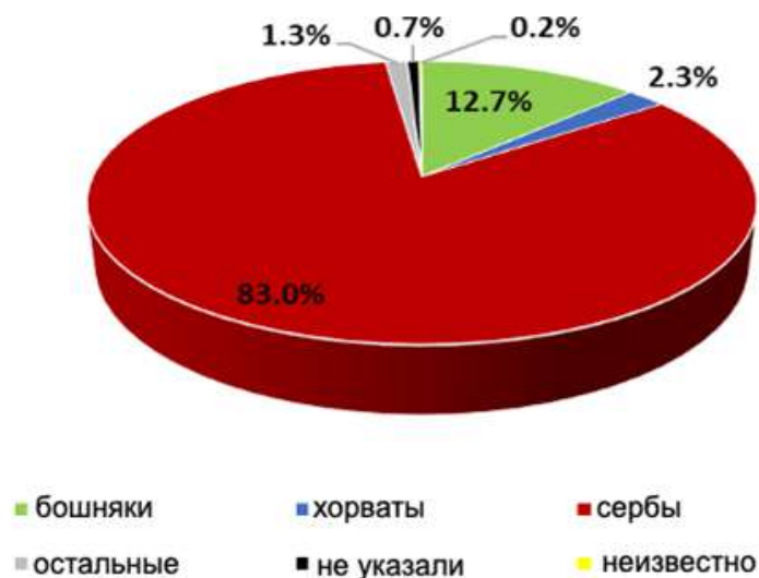
Рис. 3. Этнонациональная структура населения Республики Сербской согласно переписи 2013 г.