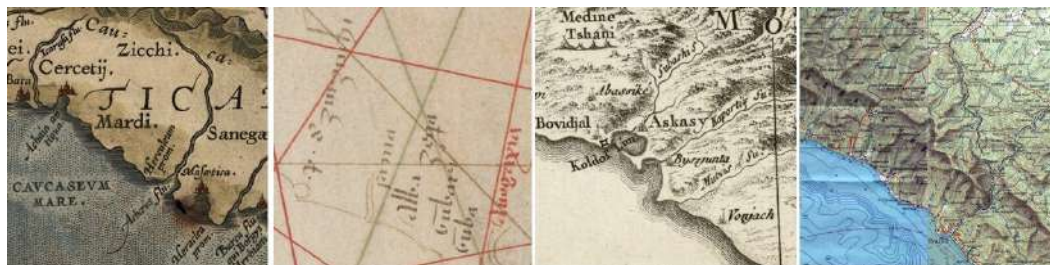
Рис. 7. Окрестности Туапсе на картах А. Ортелия (1590 г.), П. Весконте (1320 г.), Д. А. Б. Рицци-Дзаннони (1774 г.) и Генштаба СССР (1979 г.)