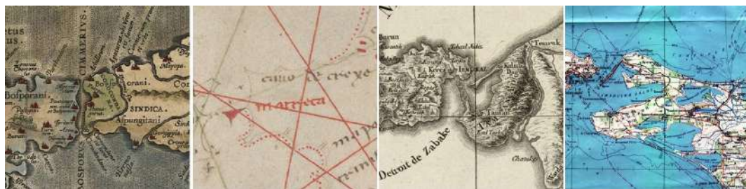
Рис. 4. Окрестности Тамани на картах А. Ортелия (1590 г.), П. Веконте (1320 г.), Д. А. Б. Рицци-Дзаннони (1774 г.) и Генштаба СССР (1979 г.)