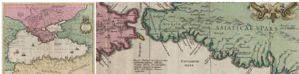
Рис. 1. «Перипл» Николя Сансона и Пьера Мортье (1700 г.) и его фрагмент Fig. 1. N. Sanson & P. Mortier “Ponti Evxini Periplus” (1700) and its fragment