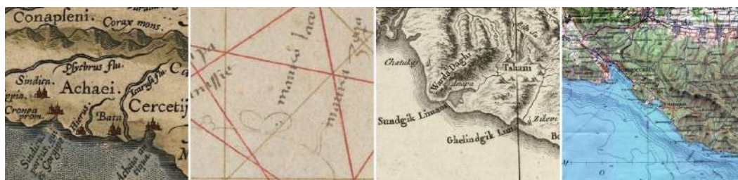
Рис. 6. Окрестности Новороссийска и Геленджика на картах А. Ортелиуса (1590 г.), П. Веконте (1320 г.), Д. А. Б. Рицци-Дзаннони (1774 г.) и Генштаба СССР (1979 г.)

Окрестности Новороссийска и Геленджика (рис. 6). Современный город Новороссийск (1320 — trinissie ; 1375 — trinissie ; 1380 — trinissie ; 1436 — chiga ; 1466 — trinici ; 1543 — trinisio ; 1559 — trinica ; 1589, 1659 — Trinici ; 1590, 1700 — Sindicus portus, qui et Gorgipe ; 1742 — Rabent ; 1760 — Soundgik ou Anapa ; 1774, 1777, 1783 — Anapa ; 1795 — крепость Суджукъ Кале ; 1796 — укрепление Анапа ; 1799 — крепость Жуджукъ Кале ; 1871, 1875, 1888 — Новоросійскъ ) расположен в устье реки Старый Цемес (Цемесс) , впадающей в Цемесскую (Новороссийскую) бухту (1717 — Bujuk Limon at Grote Haven ; 1720 — Bolselimanun ; 1743 — Bulzuc Liman v. Bolseliman ; 1774, 1777 — Sundgik Limani ; 1783 — Sunelgik L. ). В верховьях Старого Цемеса отмечены селение Борисовка (1720, 1730, 1733, 1740, 1742, 1748 — Carpo ; 1743 — Carpo fort Gorgippia ) и местные народности — церцеты , зикхи , цханы , джикеты (1743 — Cercetae Strabonis, Zicchi ; 1774, 1777, 1783 — Tshani ; 1776 — Djiketi ). К западу от Новороссийска — деревня Федотовка (1888) и посёлок Абрау-Дюрсо (1888 — Абрау ). К востоку, между Новороссийском и Геленджиком — современное село Кабардинка (1436 — chalolimena ; 1466 — Calolimea ; 1543 — calolimene ; 1559 — p: caloli mera ; 1589, 1659 — Calolimiona ; 1590, 1700 — Hierus ; 1720, 1740, 1742 — Cudac ; 1720, 1730, 1733, 1748 — Cudos ; 1743 — Hieros v. sanct. portus Bata ; 1875 — Кабардинка ; 1888 — Кабардинская ).