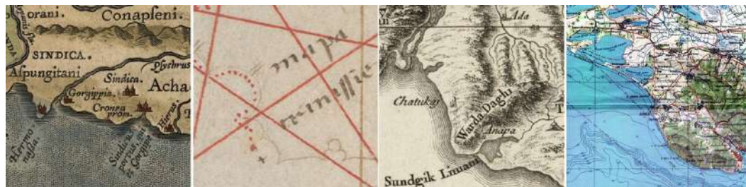
Рис. 5. Окрестности Анапы на картах А. Ортелия (1590 г.), П. Весконте (1320 г.), Д. А. Б. Рицци-Дзаннони (1774 г.) и Генштаба СССР (1979 г.)

Утриш (952/1711 — Turganerch I. ; 1590 — Cronea prom ; 1700 — Cronia prom ). К юго-востоку — станица Раевская (1590 — Sindica ; 1700 — Sindiaa ; 1742 — Karpe ; 1888 — Раевская ), к востоку — станица Натухаевская (1888 — Натухайская ). За городом начинаются возвышенности — хребет Навагир, предгорья и западные отроги Главного Кавказского хребта (1760 — Varda Daghi ; 1774 — Warda Daghi ).