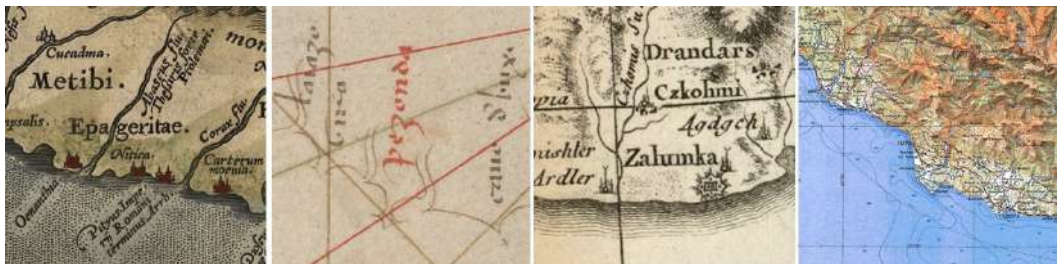
Рис. 9. Окрестности Пицунды на картах А. Ортелия (1590 г.), П. Веконте (1320 г.), Д. А. Б. Рицци-Дзаннони (1774 г.) и Генштаба СССР (1979 г.)

Окрестности Пицунды (рис. 9). Узкой полоской между берегом моря и взмывающими над ним горами километровой высоты протянулся город Гагра (1320 — sacari ; 1375 — sacari ; 1380 — sacari ; 1436 — chatari ; 1466 — Sacari ; 1543 — sacoori ; 1559 — sacari ; 1589, 1659 — Cacari ; 1590, 1700, 1743 — Nitica ; 1717 — Dervent ; 1720, 1748 — Alba ; 1760 — Derbend ; 1776 — Derbent ; 1875, 1888 — Гагры ). За ним — посёлок Бзыбь (1375 — Zoasofia ; 1380 — Ξea Zofia ; 1436 — Ξa Sofia ; 1466 — Sca Soffia ; 1543 — s. sofia ; 1589, 1659 — S. Sophia ol. f. Oenanthia , S. Sophia olim C. Onanthia ) и селение Ахваджа (1740, 1742 — Mauro ) на реке Бзыбь (1320 — laiazo ; 1888 — Бзыбь ), при впадении которой часто выделен ныне безымянный мыс (1320 — guro ; 1375 — Guro ; 1380 — Guro ; 1436 — giro ; 1466 — Cauro de Giro ; 1543 — c. degiro ; 1559 — giro ; 1589, 1659 — C. de Giro ).