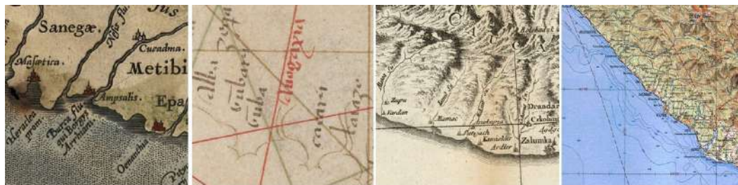
Рис. 8. Окрестности Сочи и Адлера на картах А. Ортелия (1590 г.), П. Весконте (1320 г.), Д. А. Б. Рицци-Дзаннони (1774 г.) и Генштаба СССР (1979 г.)

Nefis flu; 1700 — Nefus flu; 1888 — Дагомысь ). Село Волковка (1888 — Волховское ) — в среднем течении реки Дагомыс Западный. Ближайший к центру города с северо-западной стороны — посёлок Мамайка (1717 — Catchai temay; 1743 — Port. Hadgiamber; 1760 — укрепление Матай; 1774, 1777, 1783 — Матас; 1776 — укрепление Матай; 1799 — Мамай ) в устье реки Псахе ( Мамайка; 1774 — Ismil Su; 1776 — Moutzis R.; 1777 — Ismil Su. ).