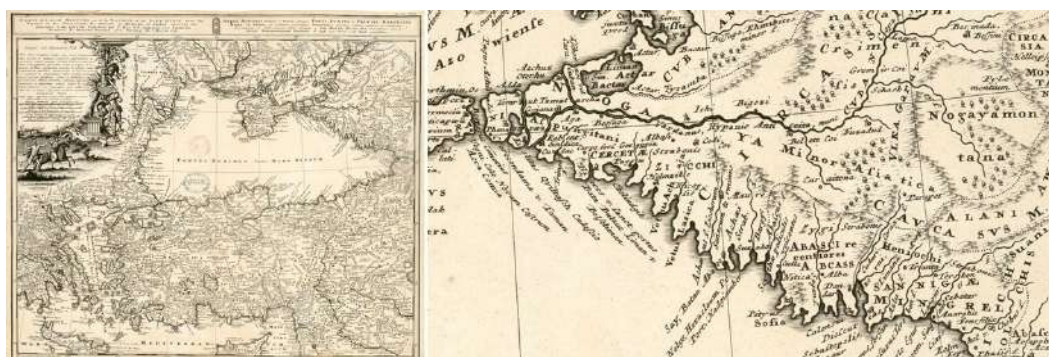
Рис. 2. «Карта Малой Азии или Натолии и Понта Эвксинского...» Иоганна Матиаса Газе (1743 г.) и его фрагмент